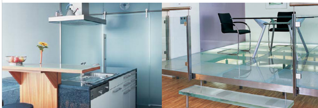
Glaswände wie Samt. Offen für neue Ideen: Besprechungszonen