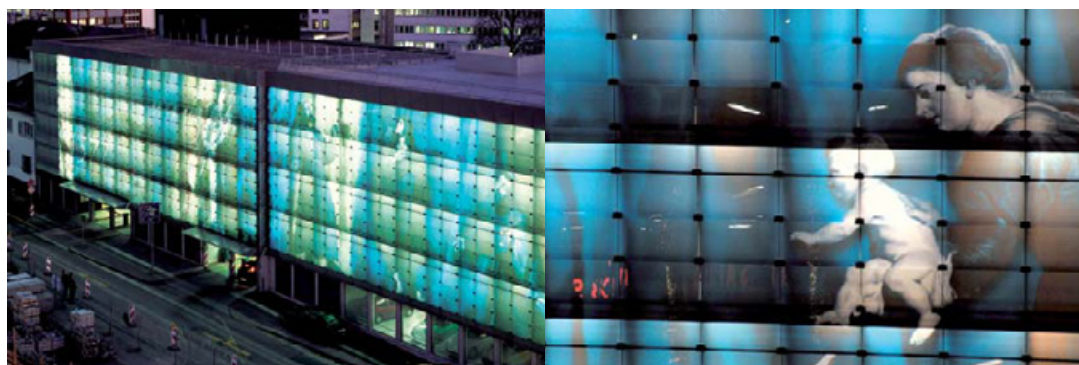
Die Medienfassade als Attraktion im Städtebild